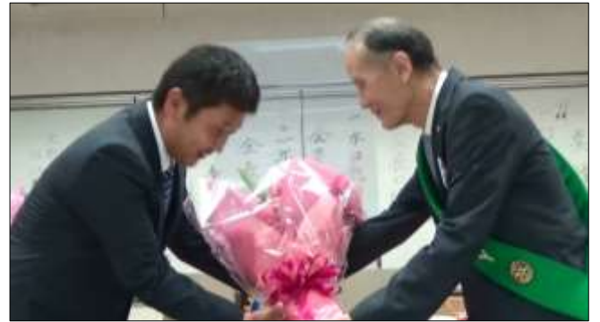
新幹事から幹事へ花束贈呈