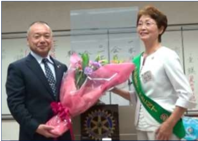
新会長から会長へ花束贈呈